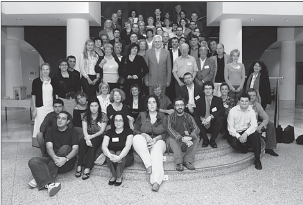
CEV-leden in Barcelona

Het is gekend dat het beleid van de EU zich vooral richt op arbeidsmarktgerelateerde en economische vraagstukken. Dat neemt niet weg dat er ook een Europees Maatschappelijk Middenveld actief is zoals het CEV, Het Sociaal Platform, ... die zich richten op een duidelijkere ondersteuning vanuit Europa voor deze aspecten van de Europese realiteit.